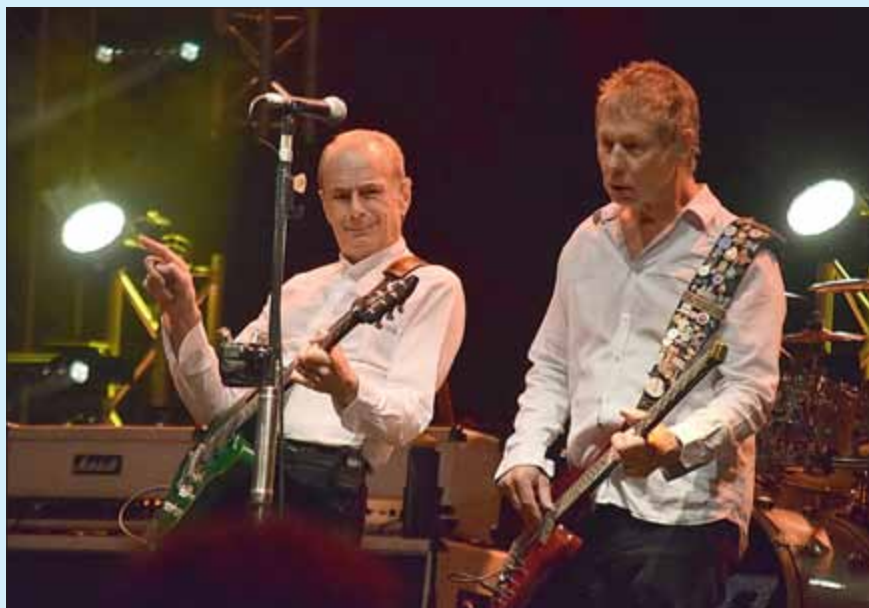
Vor allem der Bandgründer, Sänger und Gitarrist Francis Rossi (links) riss das begeisterte Publikum mit.

Dass der Bandgründer, Sänger, Gitarrist und Komponist Francis